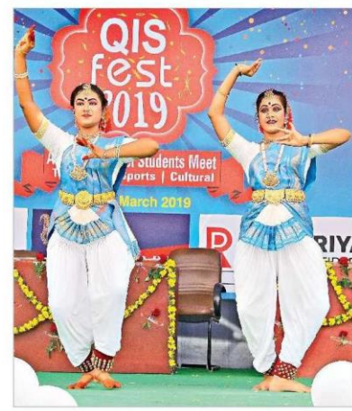
విద్యార్థుల సంప్రదాయ శృత్య ప్రదర్శన