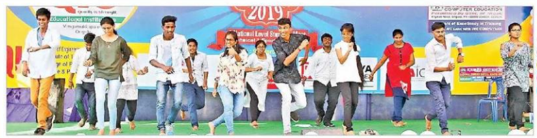
విద్యార్థుల శృత్య సందడి