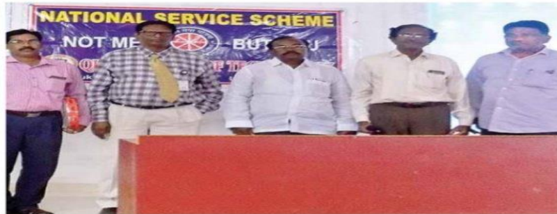
Participants at an awareness programme on viral fevers