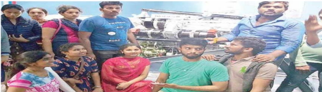
QIS students at the Visakhapatnam Steel Plant