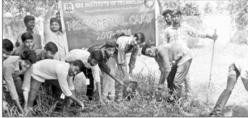
పరిసరాలను శుభ్రం చేస్తున్న ఎన్ఎస్ఎస్ విద్యార్థులు