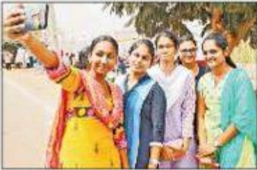
పిల్లల క్రీడ కళాశాలలో విద్యార్థినులు

విద్యార్థులను అభివృద్ధి చేసేందుకు ప్రోత్సహించేలా వారు ప్రణాళిక చేశారు. విద్యార్థులను అభివృద్ధి చేసేందుకు ప్రోత్సహించేలా వారు ప్రణాళిక చేశారు. విద్యార్థులను అభివృద్ధి చేసేందుకు ప్రోత్సహించేలా వారు ప్రణాళిక చేశారు.