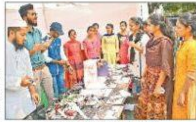
క్రీడ కళాశాలలో విద్యార్థులు విద్యార్థులు

విద్యార్థులను అభివృద్ధి చేసేందుకు ప్రోత్సహించేలా వారు ప్రణాళిక చేశారు. విద్యార్థులను అభివృద్ధి చేసేందుకు ప్రోత్సహించేలా వారు ప్రణాళిక చేశారు.