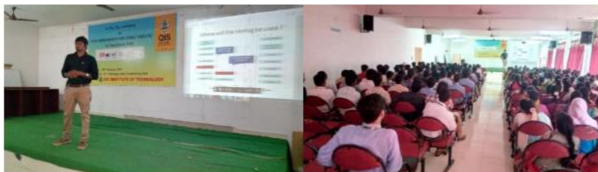
Workshop on FPGA IMPLEMENTING USING VERILOG on 15/2/2018.