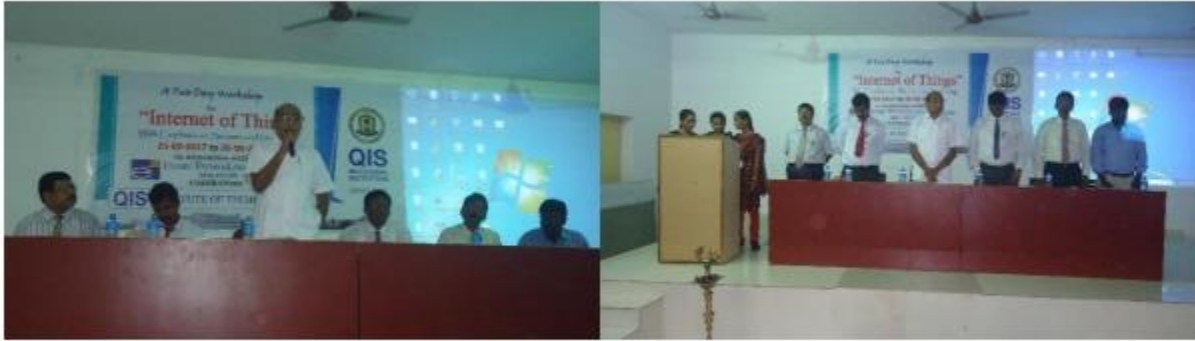
Workshop on INTERNET OF THINGS from 25/9/2017-26/9/2017

Tue, 26 September 2017 epaper.sakshi.com//c/22448753