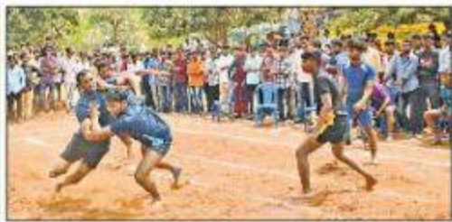
క్రీడ కళాశాలలో విద్యార్థులు విద్యార్థులు

అంగూలు క్రీడ కళాశాలలో విద్యార్థులను అభివృద్ధి చేసేందుకు ప్రోత్సహించేలా వారు ప్రణాళిక చేశారు. విద్యార్థులను అభివృద్ధి చేసేందుకు ప్రోత్సహించేలా వారు ప్రణాళిక చేశారు.