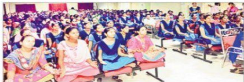
అసనాలను సాధన చేస్తున్న విద్యార్థినులు