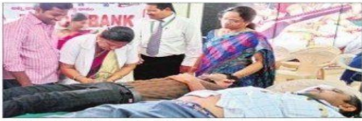
రక్తదానం చేస్తున్న క్విస్ విద్యార్థులు