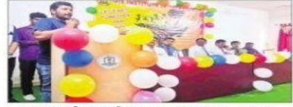
సమావేశంలో మాట్లాడుతున్న క్విస్ పూర్వ విద్యార్థి